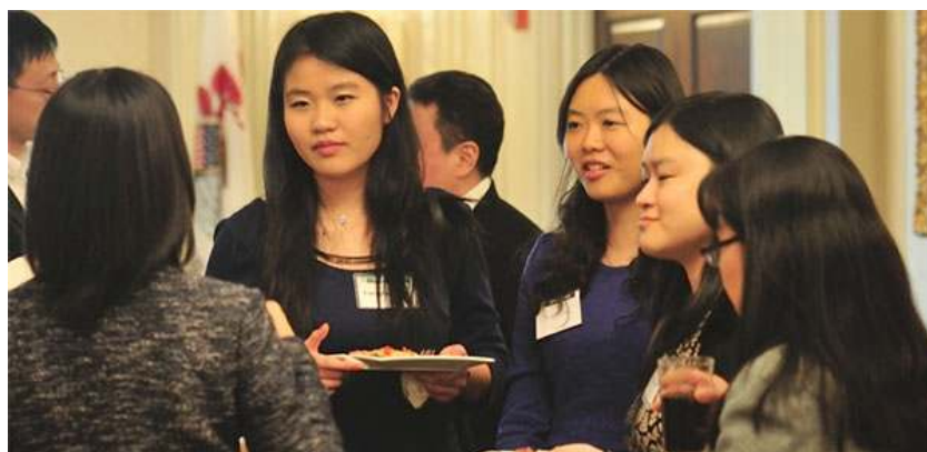
来宾现场交流联谊

新春招待会活动, 在各界与会人士包括来自晨星公司 (Morningstar) 等公司芝加哥华裔金融专业人士, 来自芝加哥地区德保罗大学、伊利诺伊理工大学, 以及专程从伊州大学香槟分校赶来的中国留学生。