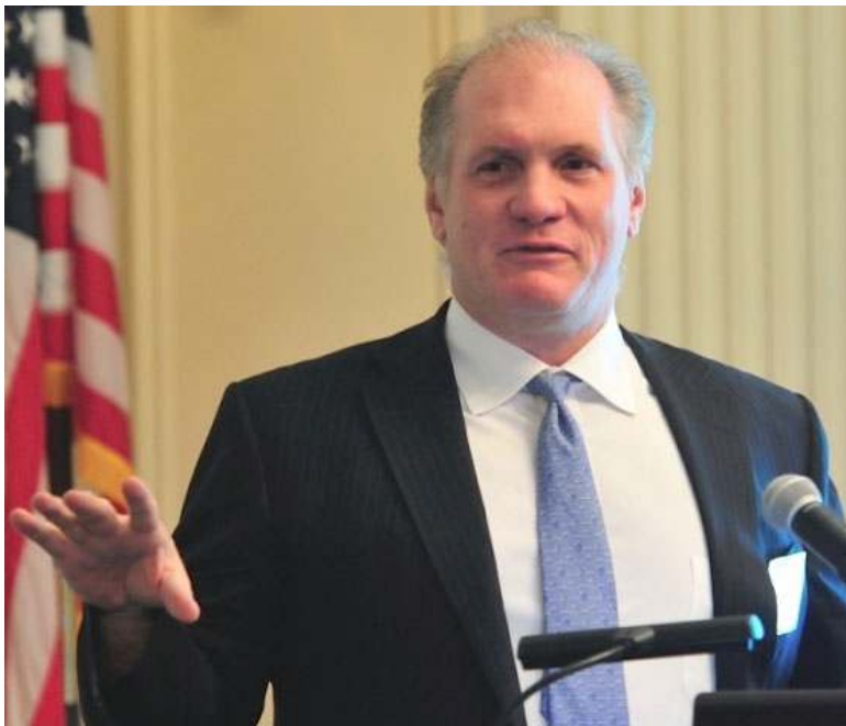
Calamos Investments全球市场投资家 Gary Black 发表演讲

在专题讲座方面, 凯拉摩斯投资公司 (Calamos Investments) 著名全球市场投资家盖瑞布莱克 (Gary Black) 就全球债券策略及宏观经济展望发表专题演讲。去年8月, 盖瑞布莱克曾在美国华人金融协会的演讲中成功预测了下半年美国股票市场的上扬趋势, 所以本次演讲也格外让人期待。